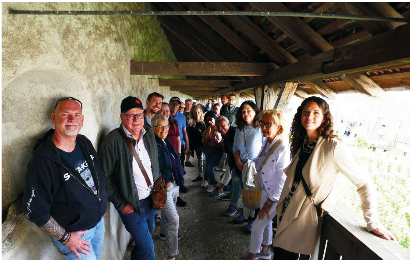
Vereinsreise 2025 nach Schaffhausen mit Besuch des Munot und Swiss Milestone Miniaturwelt.