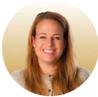
Noëmi Franchini Regie